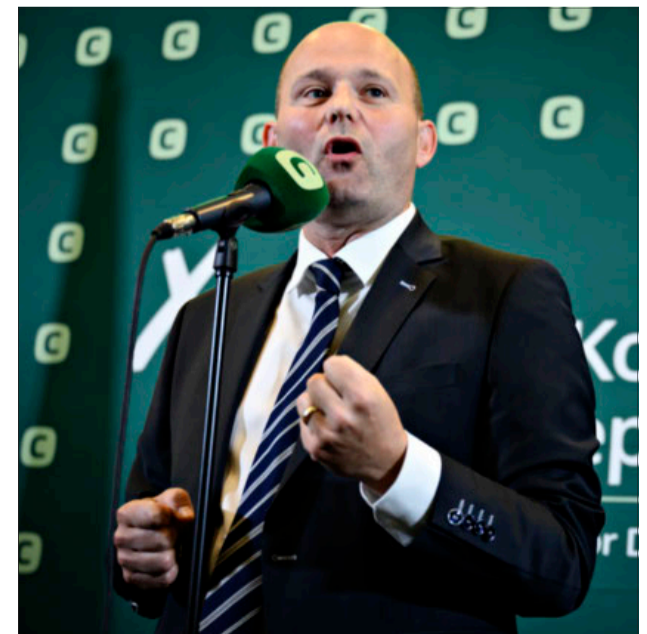
Justitsminister Søren Pape afviser ikke, at der er problemer med adgang til kvalificerede tolke. Men han kan ikke gøre noget ved det nu pga. valget, siger han.